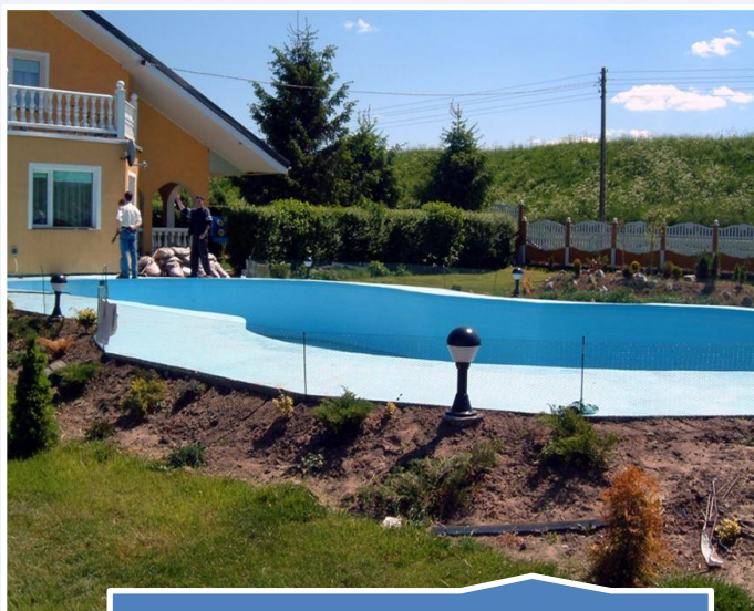
Izolacja oczek wodnych i małych basenów