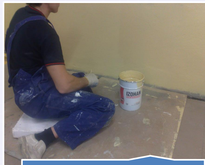
Remont zawilgoconych ścian