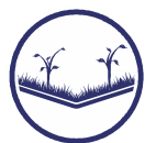
ODPORNĄ NA PRZEROST KORZENI