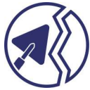
NAPRAWA KONSTRUKCJI BETONOWYCH